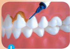
1 Aanbrengen op de tandhals

Met een stompe naald een dunne laag aanbrengen op het tandoppervlak dat moeilijk schoon te maken is met tandenpoetsen. Vermijd contact van de vernis met de tong, chloorhexidine tandvernis smaakt bitter. Gebruik niet meer dan \frac{1}{4} spuitje per keer.