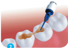
2 Aanbrengen op het kauwvlak