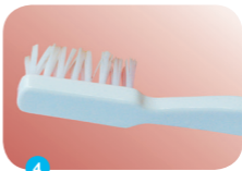
4 5 minuten niet eten en drinken en daarna de vernis wegpoetsen met een tandenborstel. Kleine stukjes uitspugen.